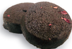
Chocolate & Pepper チョコレートペッパー