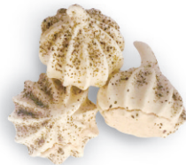
Hojicha & Yuzu