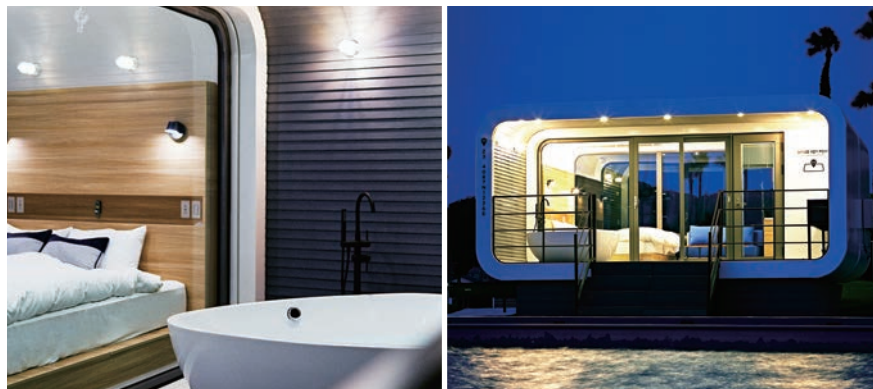
眺望にこだわり両面ガラス窓を採用した各SPACE(客室)にはキングサイズベッド、シャワールーム、ソファのほか、屋外のプライベートテラスにはバーテーブルが備えられ水着着用で寛げる。

日常から解放され 自然と同期する 2022年7月7日、日本初の 近未来デザインが目を引くトレ ラーホテル「スペースキーポ イント」を、リビエラ逗子マリーナとリ ビエラシーボニアマリーナに開業 しました。 海が広がり富士山を望む絶好の ロケーションで、刻々と変化する 幻想的なサンセットを楽しめ、自 然と同期するをコンセプトに、滞 在を通じてサステナブルな体験も 提案しています。そして、日常から 解放され心にスペースをつくり、 マインドを整える場所でありたい と願っています。 過ごしやすくなるこれからの 季節、ぜひご体感ください。