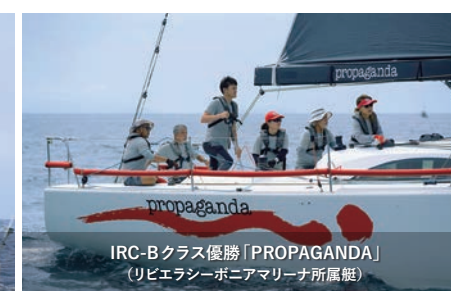
IRC-Bクラス優勝「PROPAGANDA」 (リビエラシーボニアマリーナ所属艇)