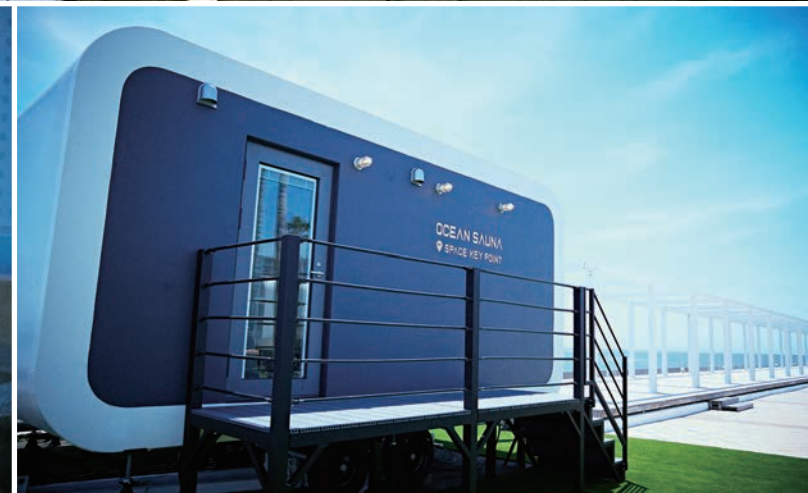
〈リビエラ逗子マリーナ〉海までわずか数メートル。サウナ室に大きな窓を設え、雄大な相模湾を見下ろす絶景のオーシャンサウナ。プライベートデッキでの水風呂と外気浴は、江の島と富士山を望み水平線が一直線に広がる海を眺め、波音をBGMに潮風を感じながら完全貸し切りでゆったりと過ごせる。