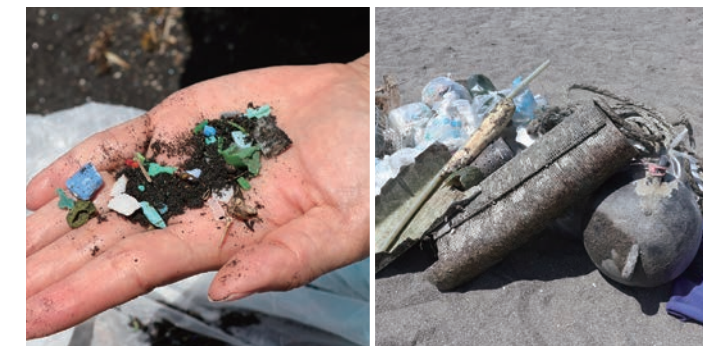
小さく砕かれた無数のマイクロプラスチック 海から打ち上がった大きなゴミ

海から打ち上がるゴミは、各海岸ごとに特徴が現れます。いつまでも漂い続けてしまう海ゴミをこれ以上出さないよう、最後のストッパーとしてのビーチクリーンが、いかに重要かを今回も痛感しました。 また、この「リビエラ湘南ビーチクリーン」では、海の環境を守ることはもちろん、「海沿いの人と人」をつなぎ、ハブとして連携強化の役割も担っていきます。それが非常時の備えにもなると信じて。