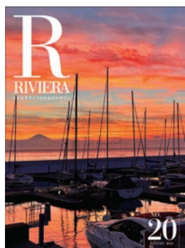
表紙:リビエラシーボニアマリーナからのサンセット