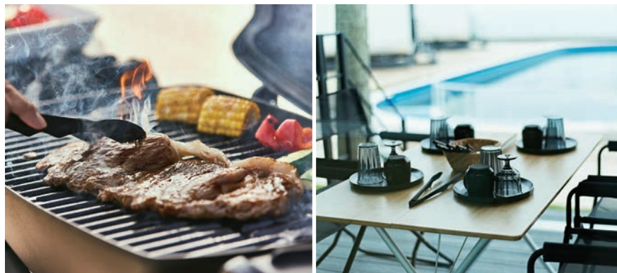
プライベートテラスにはBBQ用のグリル台やキッチン、テーブルがあり、目の前の絶景を眺めながら、また、爽やかな潮風を感じながらゆったりと過ごせる。地産地消、サステナブルな食材を用いたこだわりのBBQ、ピザ作りや杉板で焼く魚料理など、自分たちで作る料理は格別な味わい。