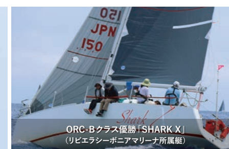
ORC-Bクラス優勝「SHARK X」 (リビエラシーボニアマリーナ所属艇)