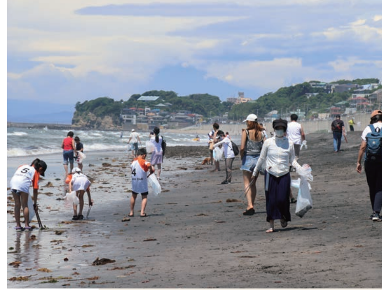
各海岸、多くの地元住民・団体等が参加する「リビエラ湘南ビーチクリーン」