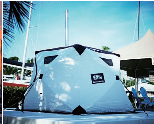
〈リビエラシーボニアマリーナ〉地球に優しいバイオマス燃料を使用したテントサウナ。インフィニティチェア(無重力椅子)を備えた「とどのい」スペースから、ハーバーに停泊するヨット越しの海、そしてオレンジに染まる幻想的な富士山を眺める。そんな「とどのい」時間を過ごせる、他に類を見ない体験を。