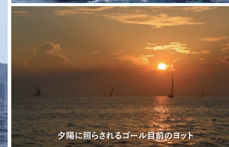
夕陽に照らされるゴール目のヨット