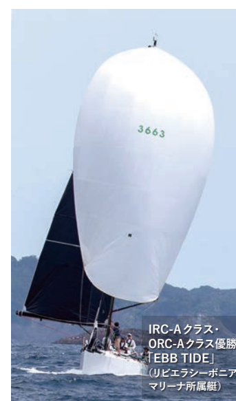
IRC-Aクラス・ ORC-Aクラス優勝 「EBB TIDE」 (リビエラシーボニア マリーナ所属艇)

秋には、恒例のリビエラ逗子マリーナヨットレース「若大将カップ」を10月9日に開催します。「若大将カップ」はレーサーだけでなくクルージング派のヨットも楽しめるヨットレースです。秋の爽やかな相模湾で一緒にレースを楽しみませんか。奮ってご参加ください。