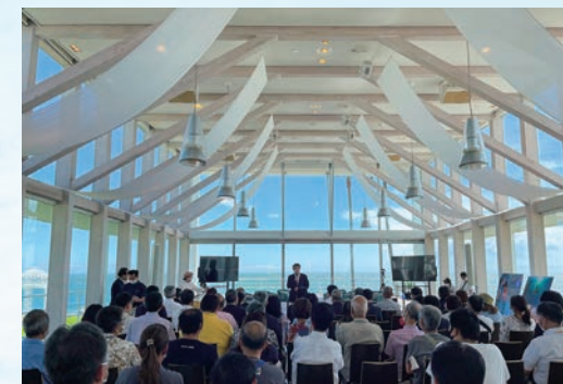
リビエラ逗子マリーナ「シースケイプ」にて開催