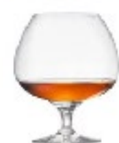
命の水 コニャック

コニャック ⇄ アングレム 全航程 118km、航行時間 28時間、ロック数 36