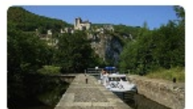
サン・シル・ラポピー

カオール ⇄ サン・シル・ラポピー 全航程 146km、航行時間 28時間、ロック数 34