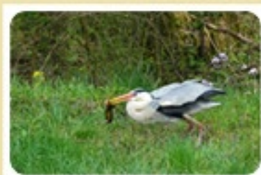
水辺のハンターあおサギ