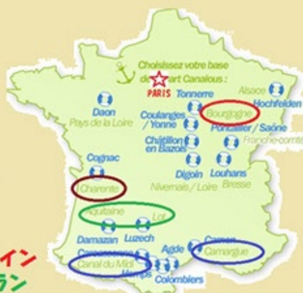
クルーズお薦め地方

各キャビンはシャワー、電動トイレ、洗面台付き 冷凍冷蔵庫、調理器具、電子レンジ、食洗機、食器完備のキッチン ラウンジはエアコン、Hi-Fi、カラーTV、DVDプレイヤー、220Vコンバーター付き、デッキにはテーブル、チェア、パラソル、シャワー 冷蔵庫、サンデッキ、2操舵席、VHF、ハウスラスター