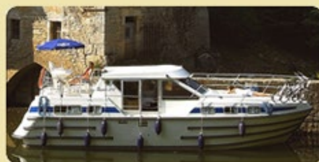
Tarpon 37 Duo Prestige

オプション: 自転車貸し出し、片道割り増し料金 ほか スキッパー (操船者) 付きプランもご用意できます。 お問い合わせください。