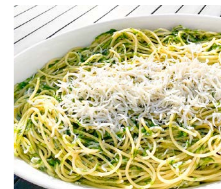
湘南しらすのアーリオオーリオ 4名様分(300g) ¥14,400