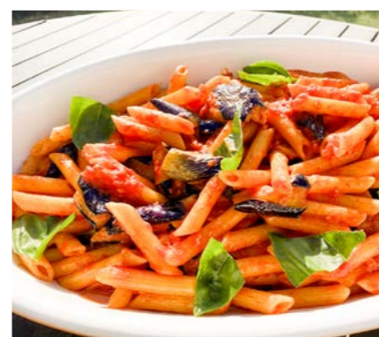
茄子のペンネアラビアータ 4名様分(300g) ¥6,600