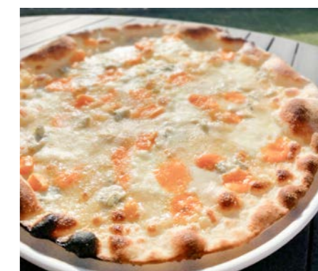
石窯Pizza クアトロフォルマッジ 2~3名様分 各¥4,320