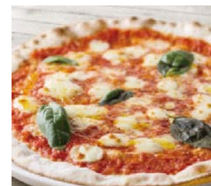
石窯Pizza マルゲリータ / しらすと青海苔 2~3名様分 各¥3,960