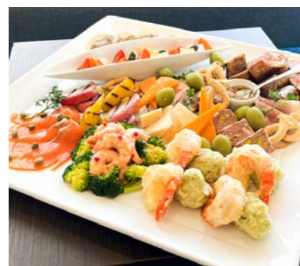
オードブル盛合せ ¥18,000

※大型連休、お盆期間、年末年始などは仕入れが難しい場合があります。お早目のご予約をお願いいたします。