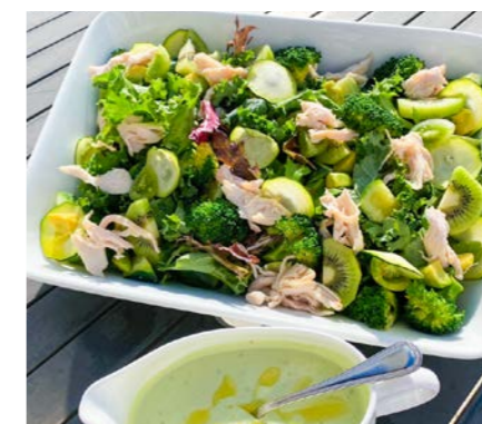
大山鶏グリーンサラダ ¥6,000