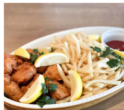
からあげ&ポテト 4名様分 ¥3,600