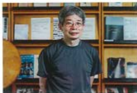
平田 オリザ（劇作家・演出家・青年団主宰 城崎国際アートセンター 芸術監督）

これらを演劇によって培うというプロジェクトで演劇の神様といわれる平田オリザさんを中心に活動を行っています。