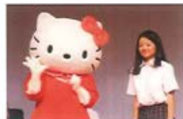
授賞式でキティちゃんと

私は、渋谷区長にも手紙を書きました。渋谷区も積極的に活動すると返事をいただきました。コロナ禍で貧困家庭が増え、この問題は深刻になりつつある一方で、認知度も高まっており、東京都ではすべての都立学校の女子トイレに生理用品を設置しているそうです。