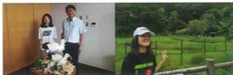
市長室にて前市長と 絶滅危惧種コウノトリ郷公園にてコウノトリと

市長とのインタビューや交流を通して知ったことをぜひみなさんにも知っていただきたくまとめます。