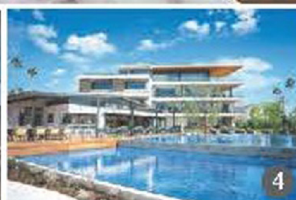
①江の島と富士山を望む ②「レストランテAO」はオーシャンビュー ③日本初上陸の「マリブファーム」 ④映画のロケ地としても有名