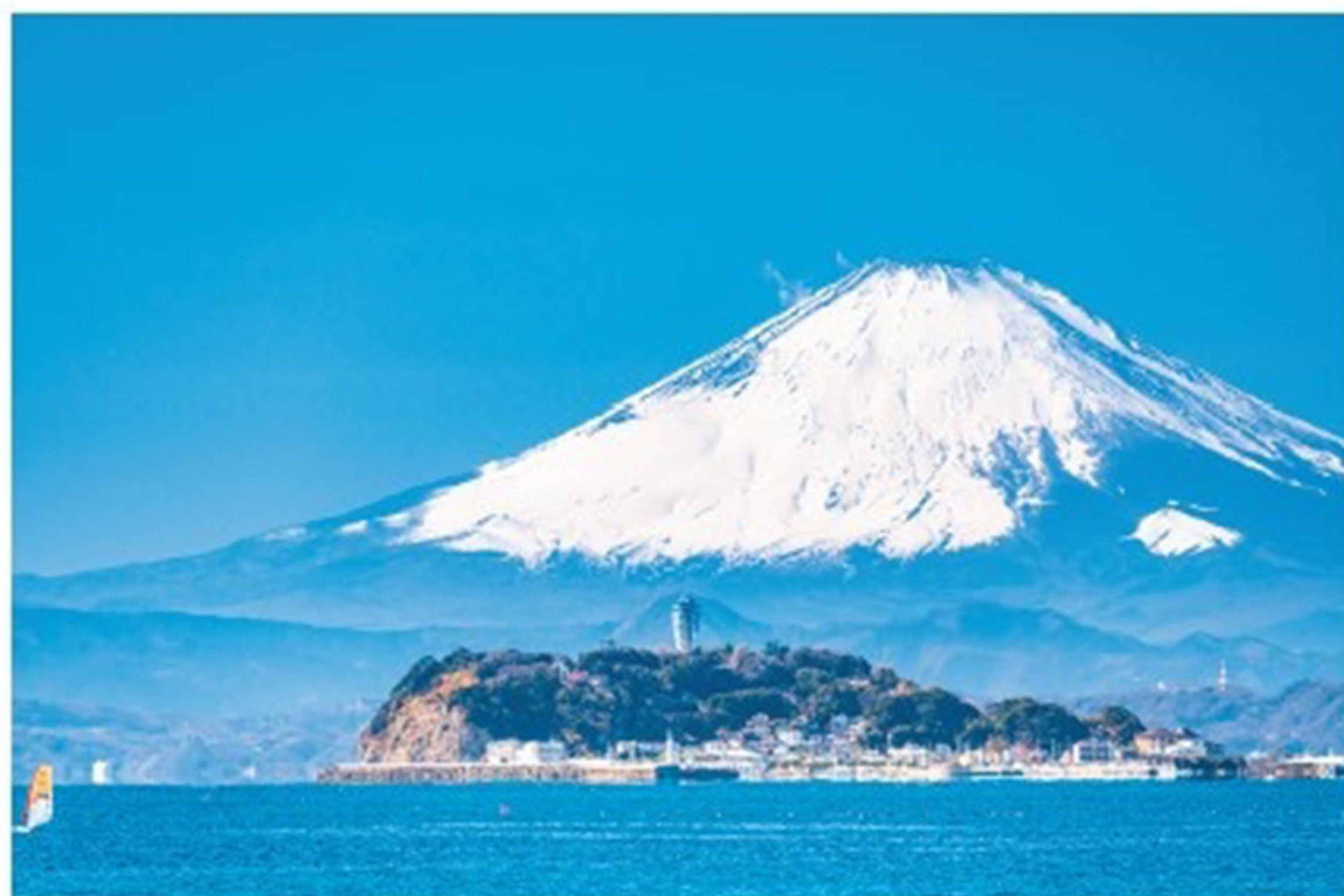
江の島の向こうに富士を望む絶景

三浦半島の付け根に位置するマリンレジャーが人気の町。中世の古都鎌倉に隣接し、当時の遺跡が多く見られる。大河ドラマ『鎌倉殿の13人』に描かれた波乱の時代にゆかりのある場所も多い。古代から重要な土地であったことを示す遺構も残っており、逗子市と葉山町の境界にある長柄桜山古墳群はそのひとつになっている。