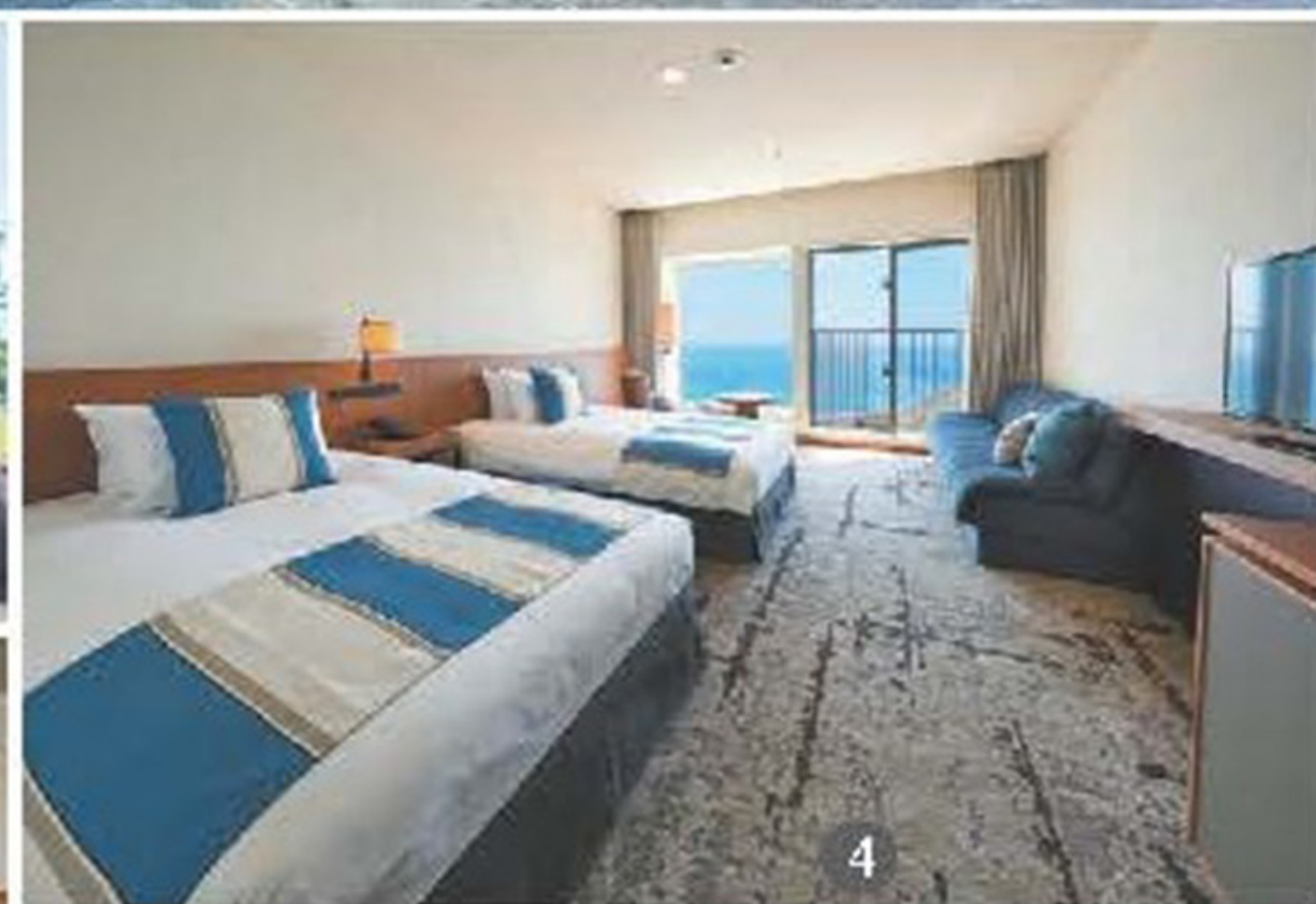
①大磯ロングビーチ ②ダイニングはビュッフェ形式 ③江の島まで見渡せる ④オーシャンビューツイン