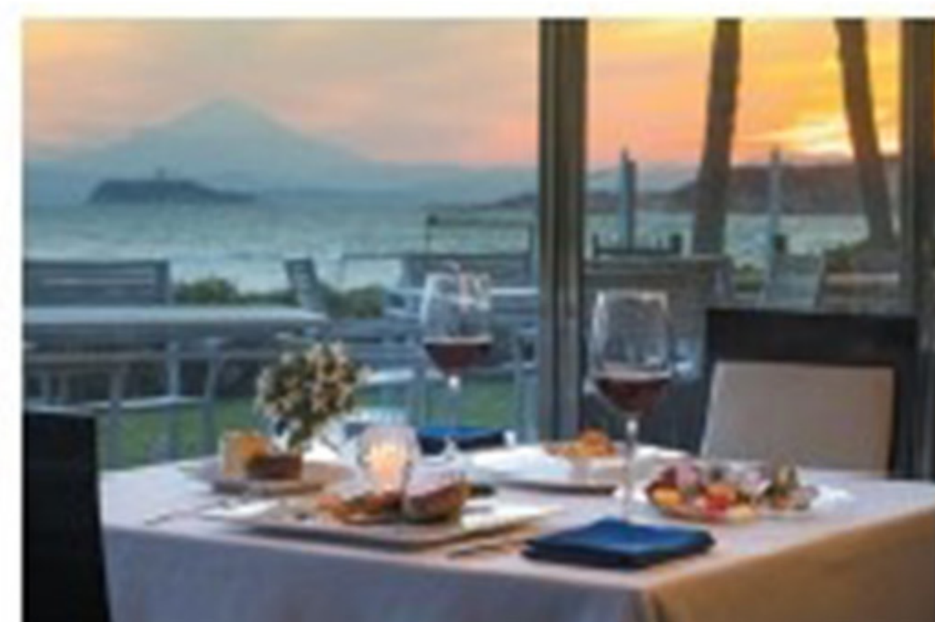
富士山を望む「リストランテAO」でディナー