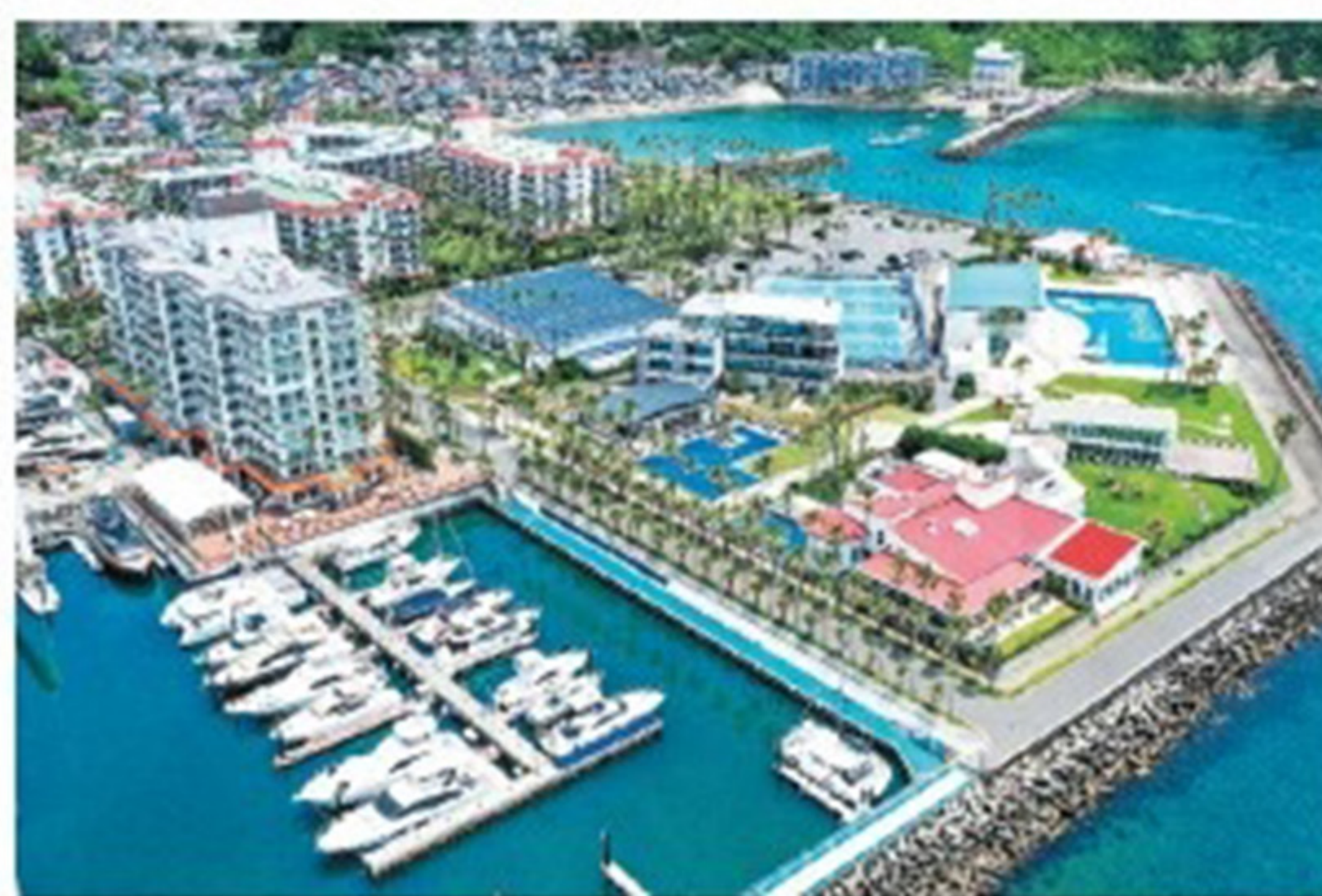
5万坪の敷地を有する大リゾート地

2006年から環境保全活動にも注力しており、コンポストや再生可能エネルギーを導入し、海のSDGsイベントも定期的に行っている。