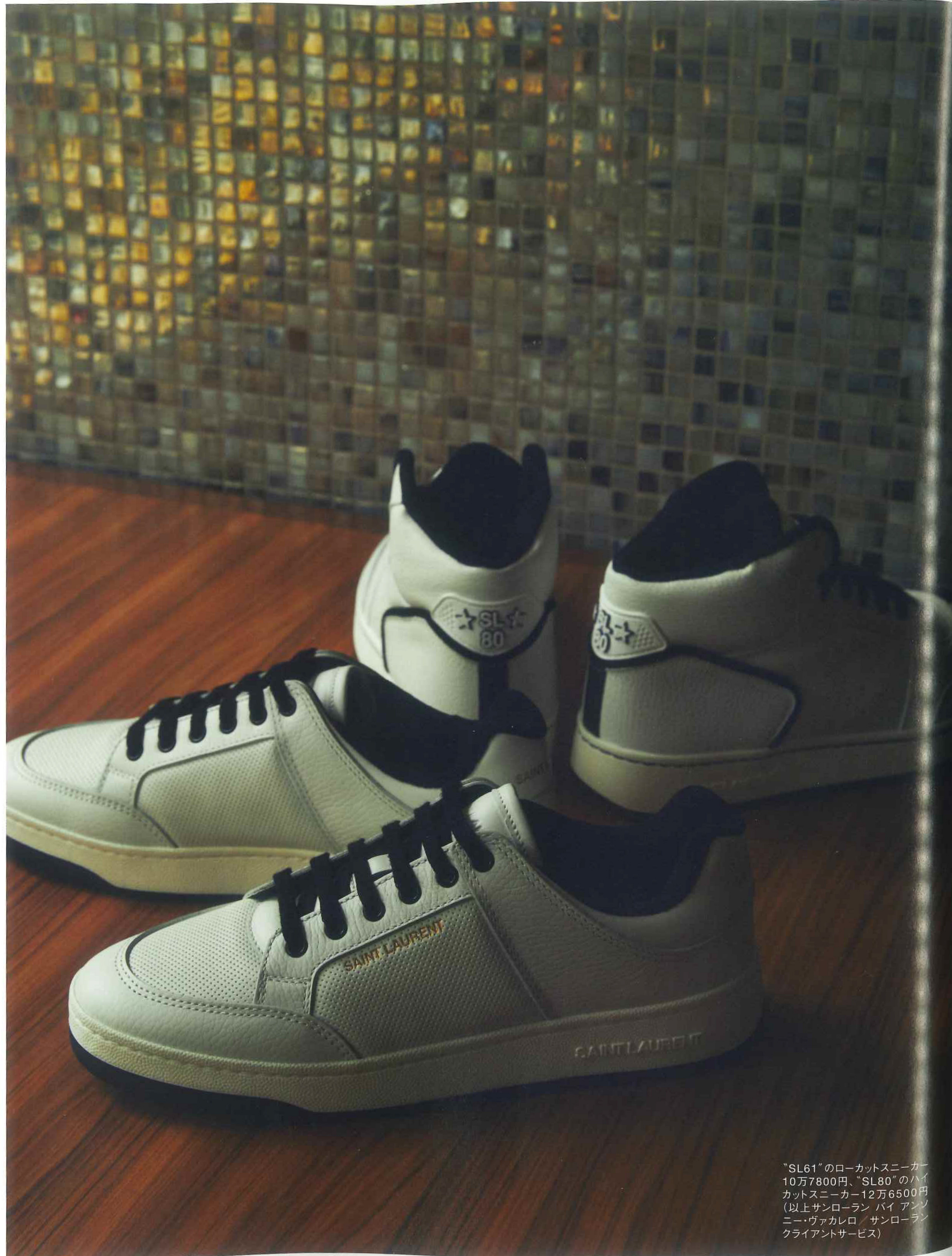
“SL61”のローカットスニーカー 10万7800円、“SL80”のハイ カットスニーカー12万6500円 (以上サンローラン バイ アンソ ニー・ヴァカレロ / サンローラン クライアントサービス)