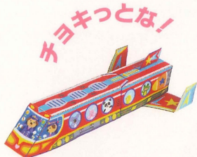
へんけいトレイン