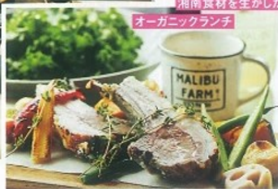
オーガニックランチ

そろそろ海外旅行に行きたいな。そんな思いを抱いている人も多 いはず。都内から1時間程度で こんなにリゾート感を満喫でき る場所は他にありません。ウオ ーターテラス席も人気です。