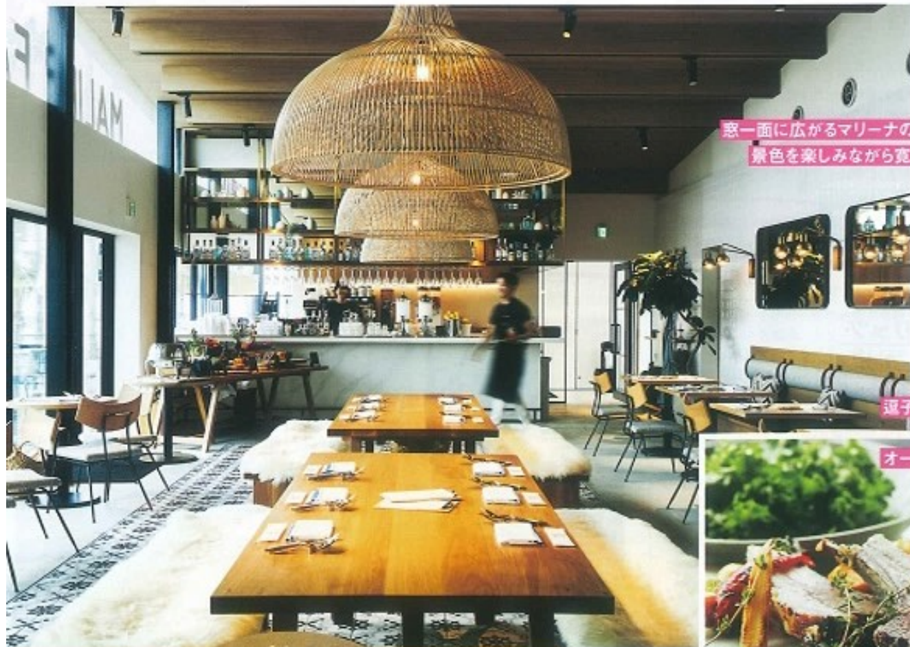
窓一面に広がるマリーナの景色を楽しみながら寛ぐ