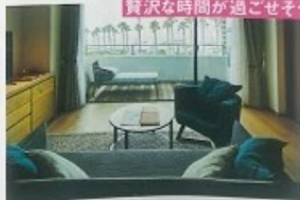
贅沢な時間が過ごせそう