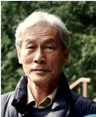
NPO 法人小網代野外活動調整会議代表 慶應義塾大学 名誉教授