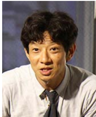
NPO 法人小網代野外活動調整会議理事 東京工業大学 教授